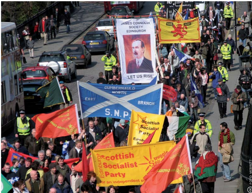
Een van de protestmarsen die de Independence First beweging in 2006 en 2007 organiseerde in Edinburgh. De betogers eisen een referendum over de onafhankelijkheid van Schotland.