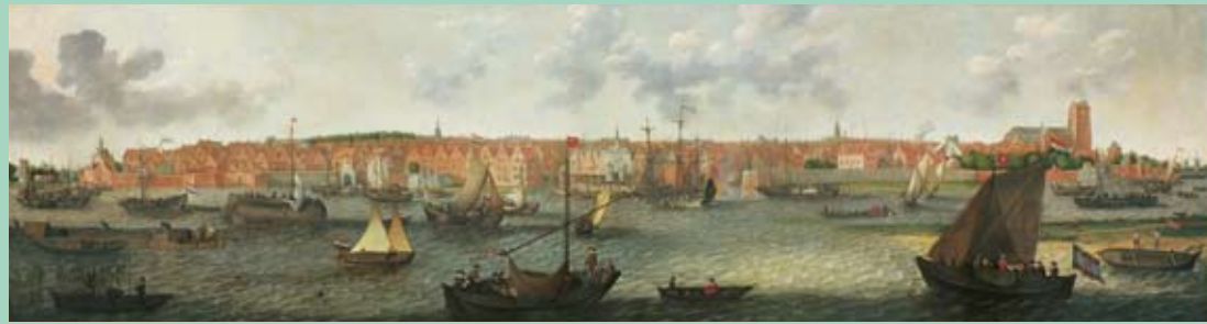
Adam Willaerts Gezicht op Dordrecht vanuit de monding van de Noord 1629 doek, 181 x 669,2 cm Dordrechts Museum