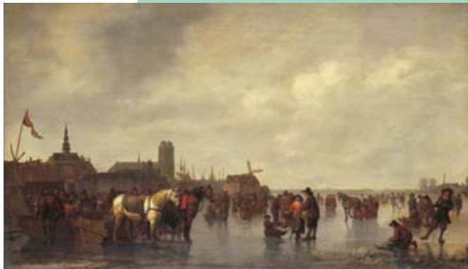
Abraham van Calraet Ijsgezicht bij Dordrecht ca. 1665 paneel, 33,5 x 57,5 cm Dordrechts Museum (in langdurig bruikleen van National Gallery, Londen)