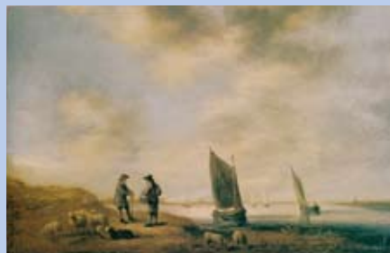
Jan van Goyen Het oude wachthuis aan de Kil 1649 paneel, 33,5 x 43,8 cm Dordrechts Museum (bruikleen particuliere collectie)