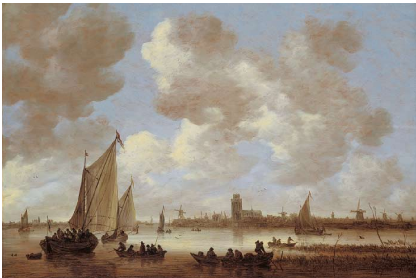
Jan van Goyen Gezicht op Dordrecht 1651 paneel, 67,2 x 98,1 cm

Jan van Goyens Gezicht op Dordrecht uit 1651 is nergens beter op zijn plaats dan in het Dordrechts Museum en leek daar, tot voor kort, een niet meer weg te denken aanwezigheid. Van Goyen heeft Dordrecht vele malen in beeld gebracht. In dit late werk trok hij nog eens alle registers van zijn superieure meesterschap open en maakte een schilderij dat zijn andere gezichten op de stad overtreft.